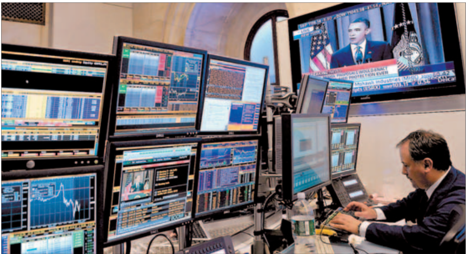
Un operador de la Bolsa de Nueva York el pasado jueves, durante el discurso de Obama sobre la reforma de la regulación financiera.