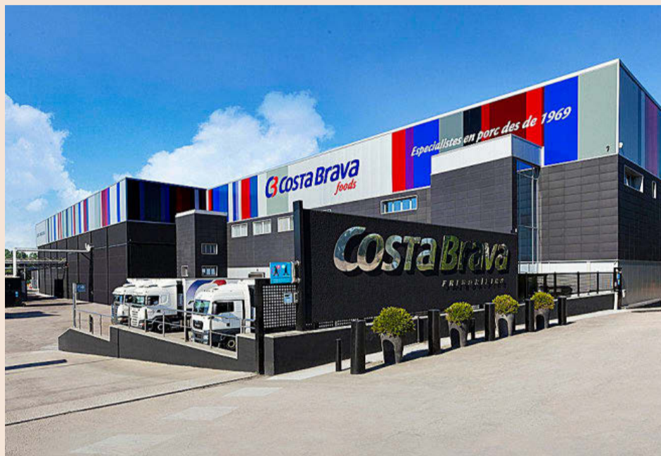
Instalaciones de Cañigueral en Riudellots (La Selva).

El grupo controla toda la cadena de producción, desde la ganadería hasta el lineal del supermercado, y opera a través de empresas como Coopern, Far Jamón Serrano, Fricafor y Collell, además de Monter y Delisano. Uno de los principales cambios que